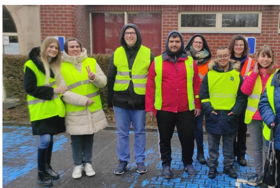
Activité citoyenne à l'Empreinte (rallye piéton)