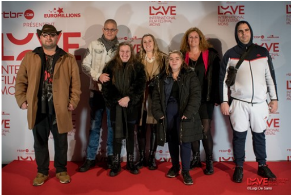
Un groupe d'itinéraires au festival du film d'amour