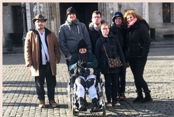
Itinéraires en sortie à Bruxelles