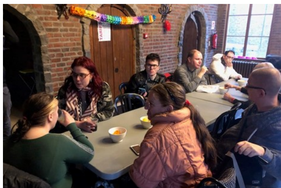
Apéro-rencontre au Château