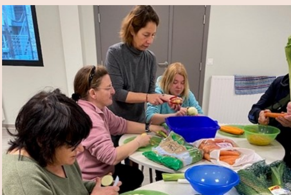
Atelier cuisine à Itinéraires