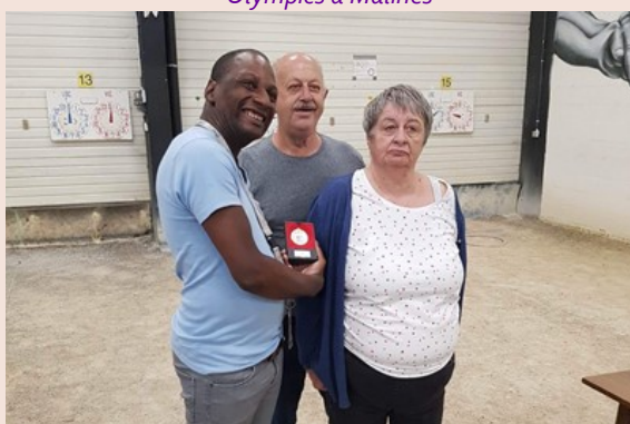
Compétition de pétanque