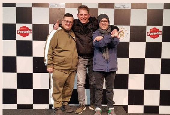
Visite des infrastructures pour les Special Olympics à Malines