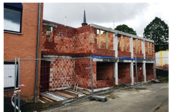
Avancement des travaux aux Oliviers