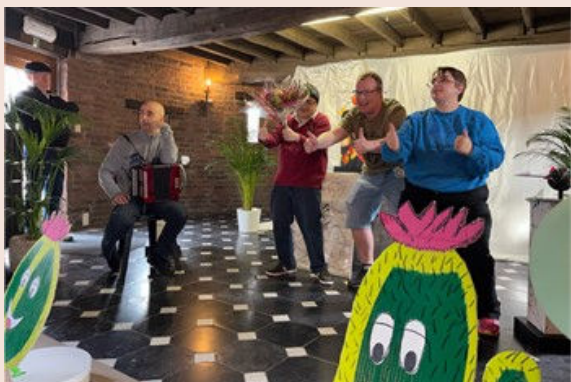
Spectacle d'expression théâtrale organisé au Château

Directeur des « Services d'Accueil du Soleil levant » de 1975 à 2014