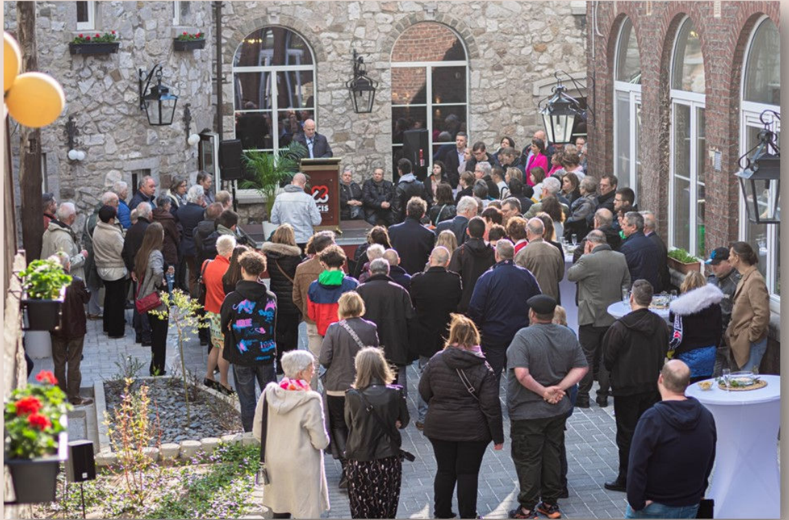
Cérémonie d'inauguration du 21 avril