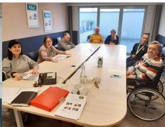
Conseil des Usagers des Oliviers