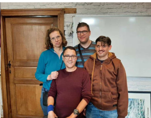
Conseil des Usagers de l'Empreinte