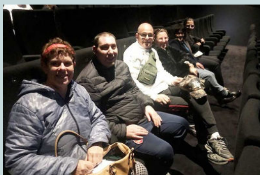
Itinéraires en sortie cinéma