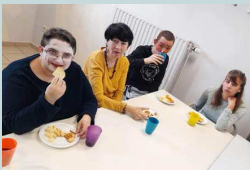
Goûter d'Halloween à l'Empreinte