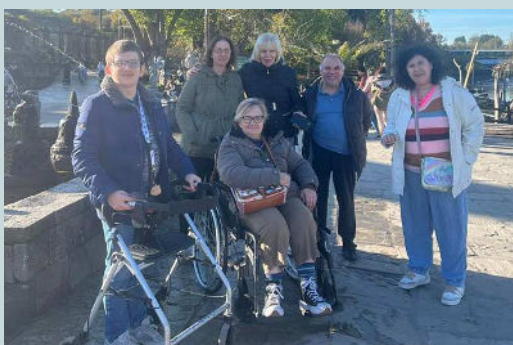
Cap 48 remercie ses bénévoles à Pairi Daiza