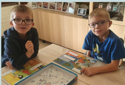
Accompagnement pédagogique chez Mao et Noa (Itinéraires)