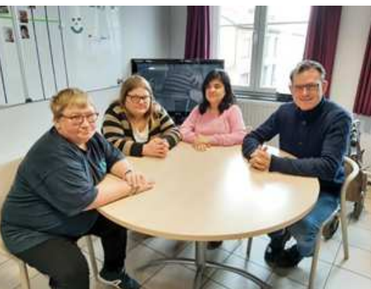
Conseil des Usagers de l'Empreinte