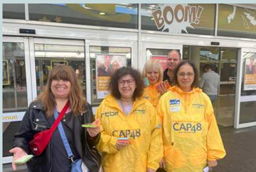
Opération Cap 48