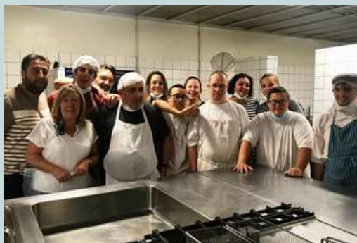
L'équipe des apprentis boulangers au salon Handicom