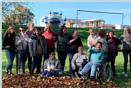
Séjour à Oteppe