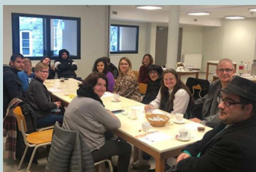
Lancement des activités collectives à Itinéraires