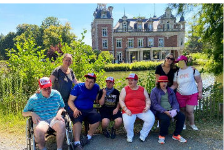
Journée au parc de Huizingen