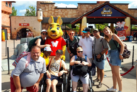
Journée à Walibi