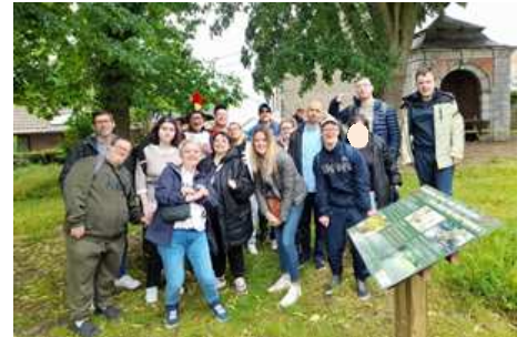
Marche Sainte-Rolende à Gerpinnes