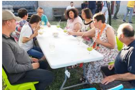
Soirée cocktails au Chaf