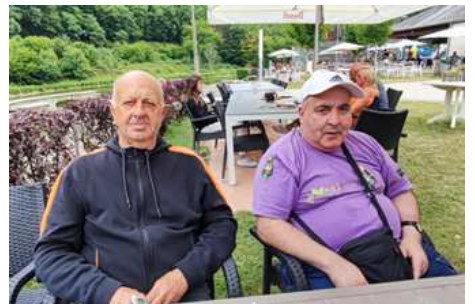
Journée dans les Ardennes