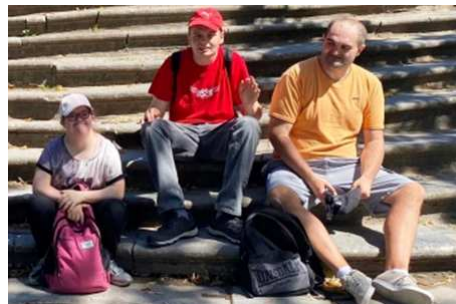
Journée à Pairi Daiza