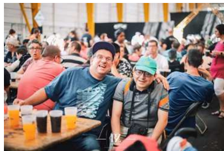
Festival Unisound à Court-Saint-Etienne