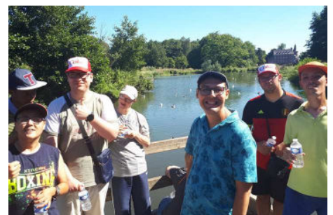
Balade au parc de Monceau-sur-Sambre