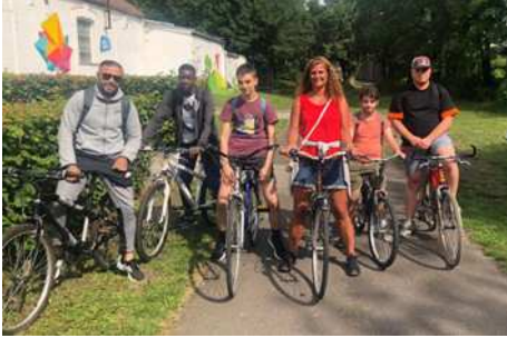
Itinéraires en balade sur le Ravel