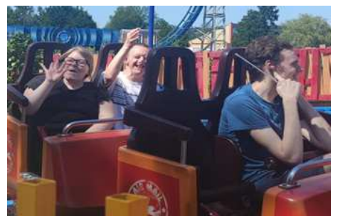
Journée à Walibi