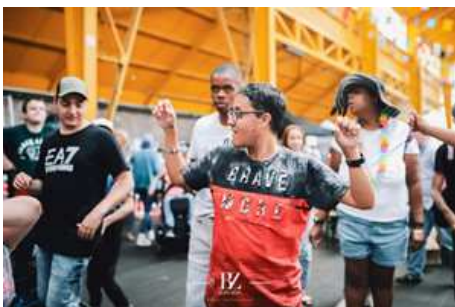
Festival Unisound à Court-Saint-Etienne