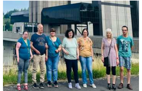
Visite de l'ascenseur de Strépy-Thieu