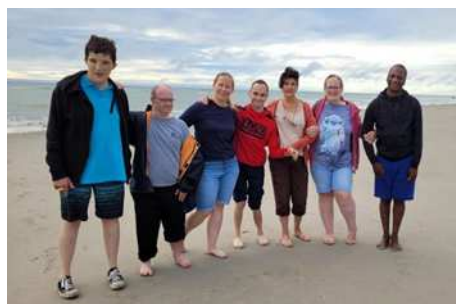
Séjour en Côte d'Opale