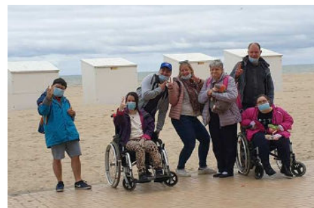
Séjour à Coxyde