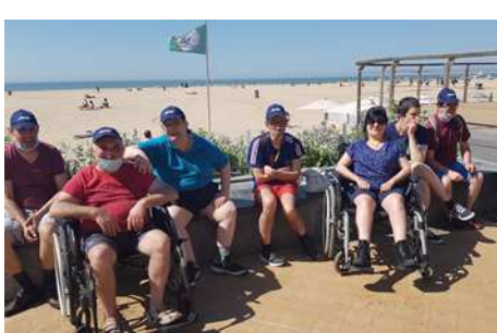
Journée à Ostende