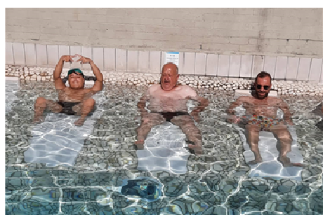
Séjour au Sunpark de Oostduinkerke