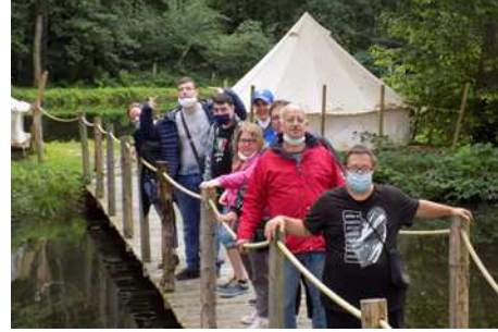
Journée dans les Ardennes