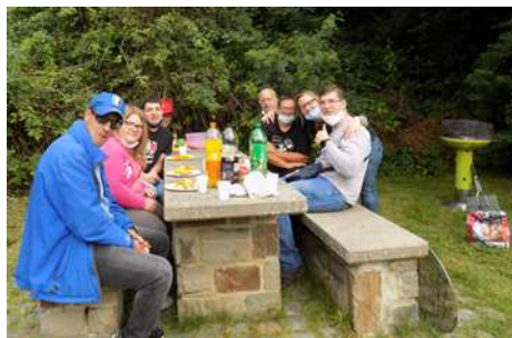
Journée dans les Ardennes