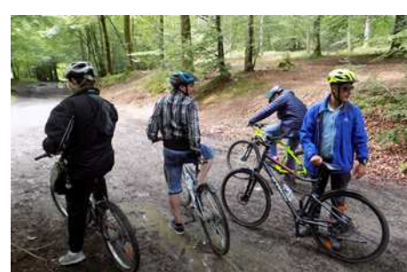
Journée dans les Ardennes