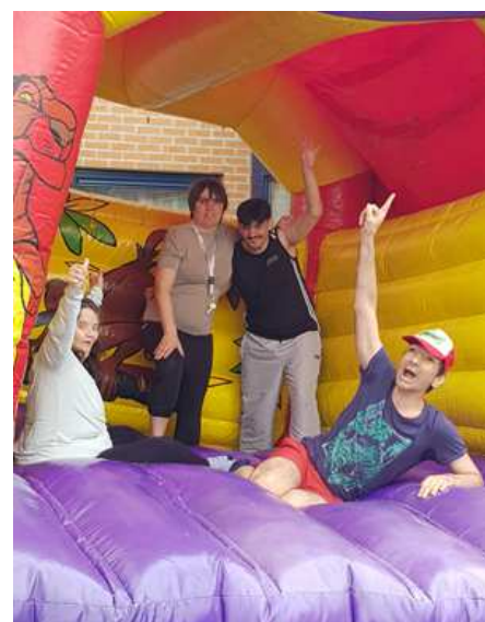
Journée récréative aux Oliviers

Si vous recevez pour la première fois notre Grand Angle et que vous souhaitez faire partie gratuitement de notre réseau d'envoi, faites-nous parvenir vos coordonnées.