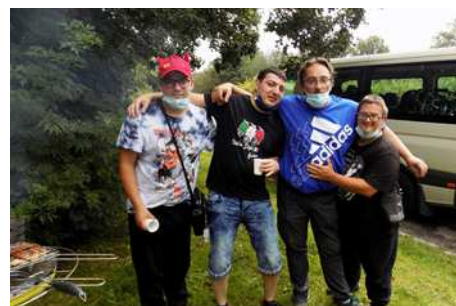
Journée dans les Ardennes