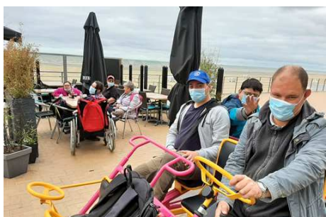
Séjour à Coxyde