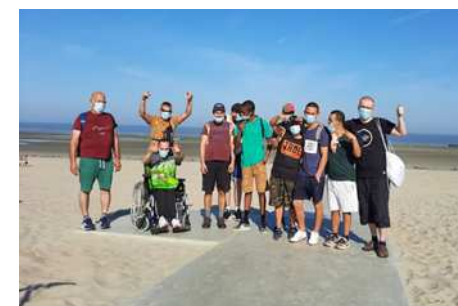
Séjour à Oostduinkerke