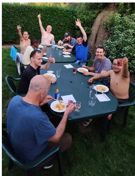
Séjour au Sunpark de Oostduinkerke