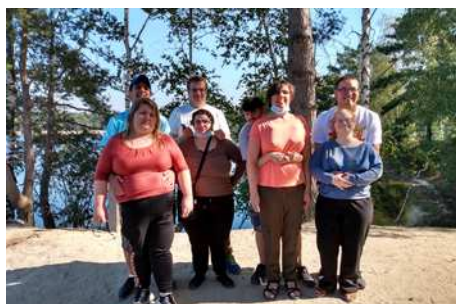
Séjour « spécial couples » au Center Parcs de De Vossemeeren