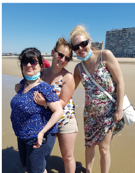
Journée à Ostende