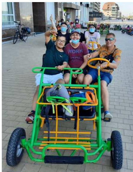
Séjour à Oostduinkerke