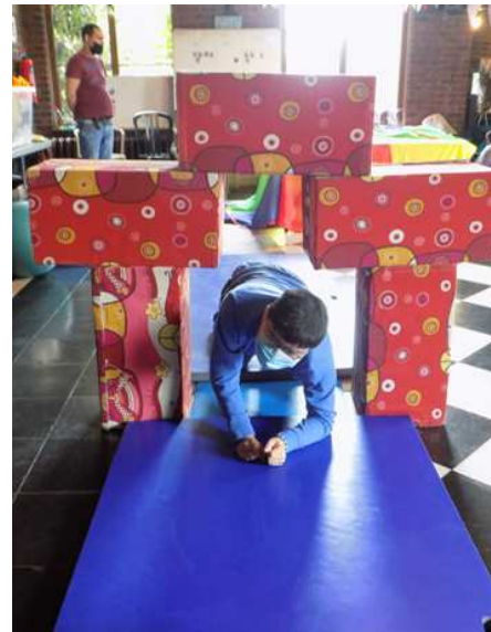
Parcours jeux et obstacles au Château